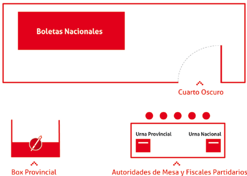
Imagen 1: Disposición de cuarto oscuro, box y mesa de votación