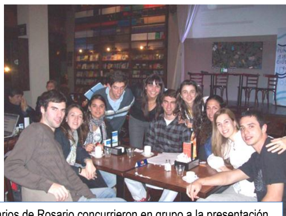
Los voluntarios de Rosario concurren en grupo a la presentación realizada en “El Cairo”.