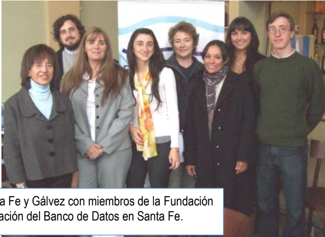
Voluntarios de Santa Fe y Gálvez con miembros de la Fundación en la presentación del Banco de Datos en Santa Fe.

Para los ciudadanos voluntarios de las ciudades de Santa Fe y Gálvez, se realizó la capacitación, conformación de equipos, asignación de candidatos y entrega de material de manera conjunta en la capital provincial el día 24 de agosto. Para dichas ciudades contamos con la participación de 8