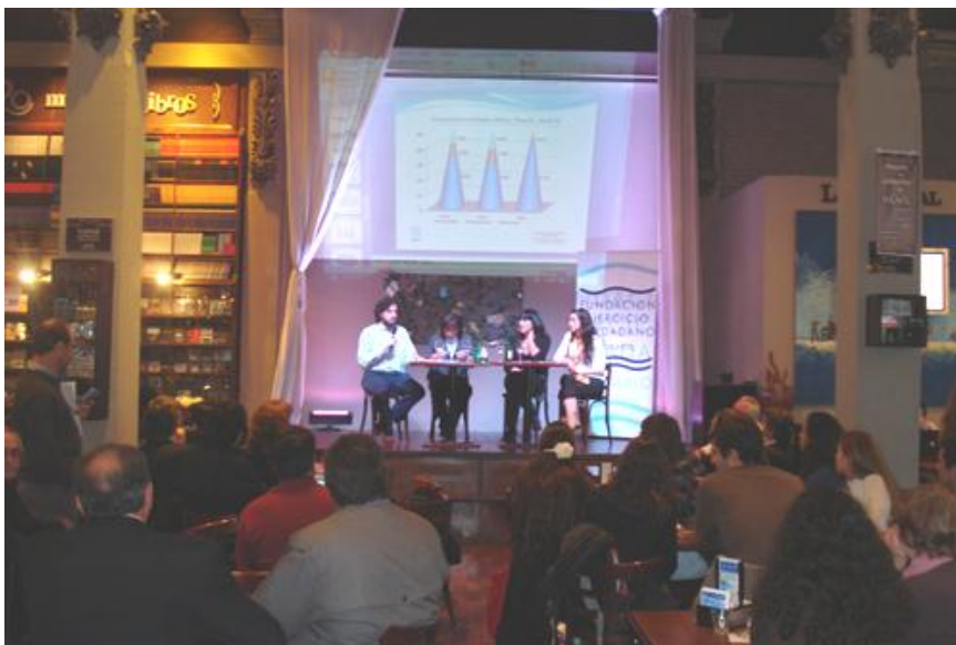
El público pudo seguir los resultados del Banco de Datos XII a través de una pantalla gigante.

El día 18 de septiembre realizamos dos presentaciones, por la mañana en “Musas del Teatro” en la ciudad de Santa Fe y por la tarde en “El Cairo”, mítico bar de la ciudad de Rosario. En el caso de los voluntarios y candidatos de la ciudad de Gálvez, los invitamos a participar, según disponibilidad, tanto en la ciudad de Rosario como en la capital provincial.