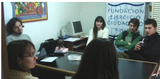
Capacitación de nuevos voluntarios para el Banco de Datos XII realizada en la oficina de la Fundación.

El lunes 11 de agosto se realizó un taller de capacitación con 9 nuevos ciudadanos voluntarios, esto nos permitió ampliar el grupo de participantes a 15 en la ciudad de Rosario. En dicha instancia también participaron voluntarios del Banco de Datos anterior, a fin de compartir su experiencia y comunicar con qué podrían encontrarse a la hora de salir a realizar el trabajo.