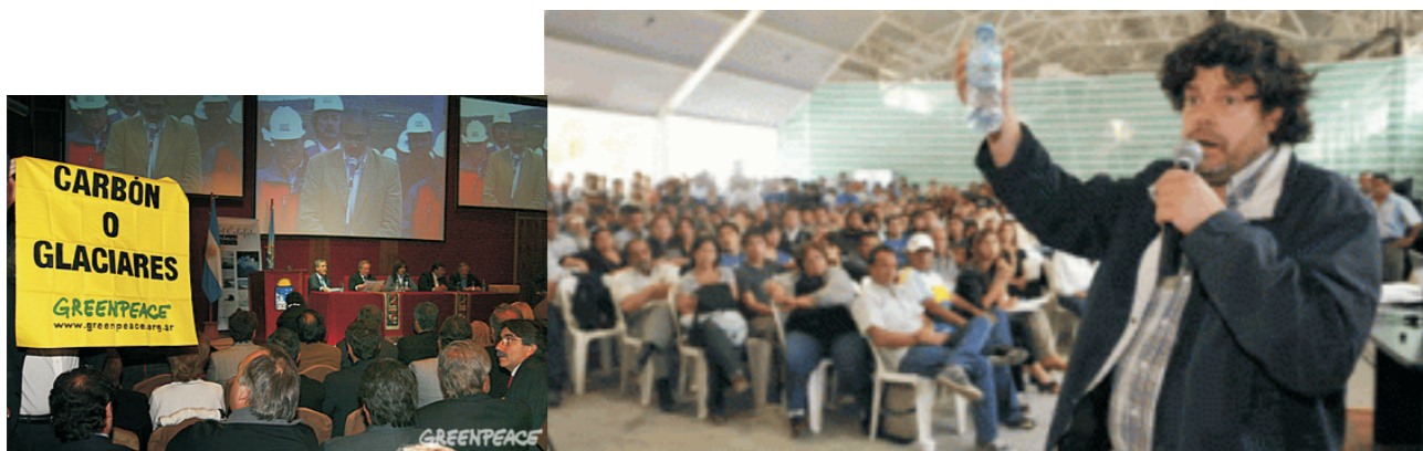
Audiencias Publicas, Ley de Hidrocarburos (2010)

La audiencia pública es una herramienta de participación basada en tres principios: publicidad (de los actos de gobierno), transparencia (en la gestión pública) y participación (de los ciudadanos y ciudadanas), puede ser convocada por la Legislatura, el Poder Ejecutivo o las Comunas para debatir asuntos de interés general de la ciudad o zonal, la que debe realizarse con la presencia inexcusable de los funcionarios competentes. Como parte del procedimiento de Doble Lectura, luego de la aprobación inicial de la norma, el Presidente convoca a audiencia pública mediante Decreto. El Presidente o Presidenta del cuerpo es la autoridad convocante y preside la Audiencia Pública.