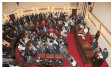
Cámara de Diputados Provincia de Santa Fe