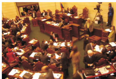
Cámara de Senadores, Provincia de Santa Fe

Estas pueden ser: Ordinarias (se celebran en días y horarios establecidos, durante el período de sesiones ordinario (entre el 1º de marzo y el 15 de diciembre de cada año); Extraordinarias (se celebran durante el receso); Especiales (se celebran fuera de los días y horas establecidos y para tratar temas específicos).